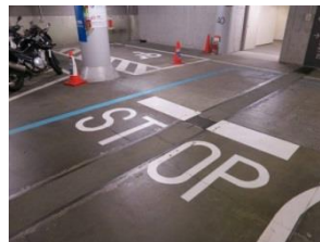
ライン引き (停止線、矢印、横断歩道等)