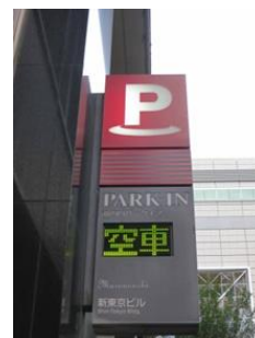
案内表示 (満空表示付)