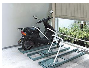
自動二輪車ラック