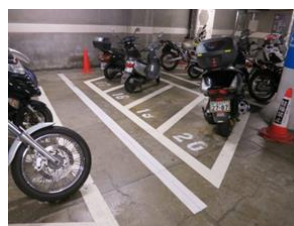
自転車駐車場および 自動二輪車駐車場のライン引き